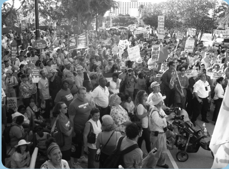
La multitud en el rally fuera de la sede de Burger King en Miami, Florida con la coalición de trabajadores de Immokalee