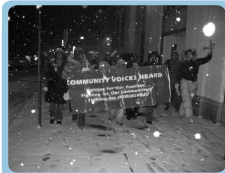
Miembros de Yonkers Marchan a la Alcaldía en Medio de la Nieve

Viene de la página 1 Miembros de Yonkers Enfrentan el Frío para Enviarle un Mensaje a la Alcaldía