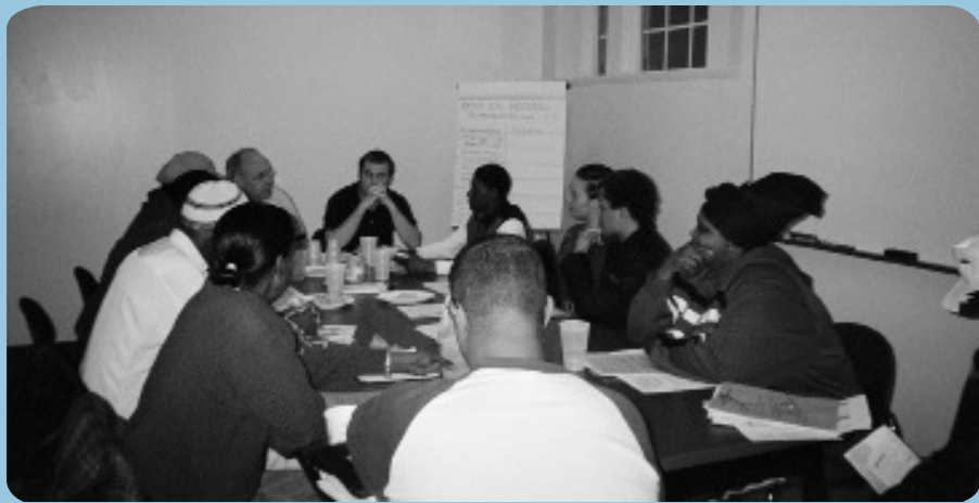
Miembros del Capítulo de Newburgh se reúnen con el Planeador de la Ciudad para dar a conocer sus preocupaciones con el Plan Maestro